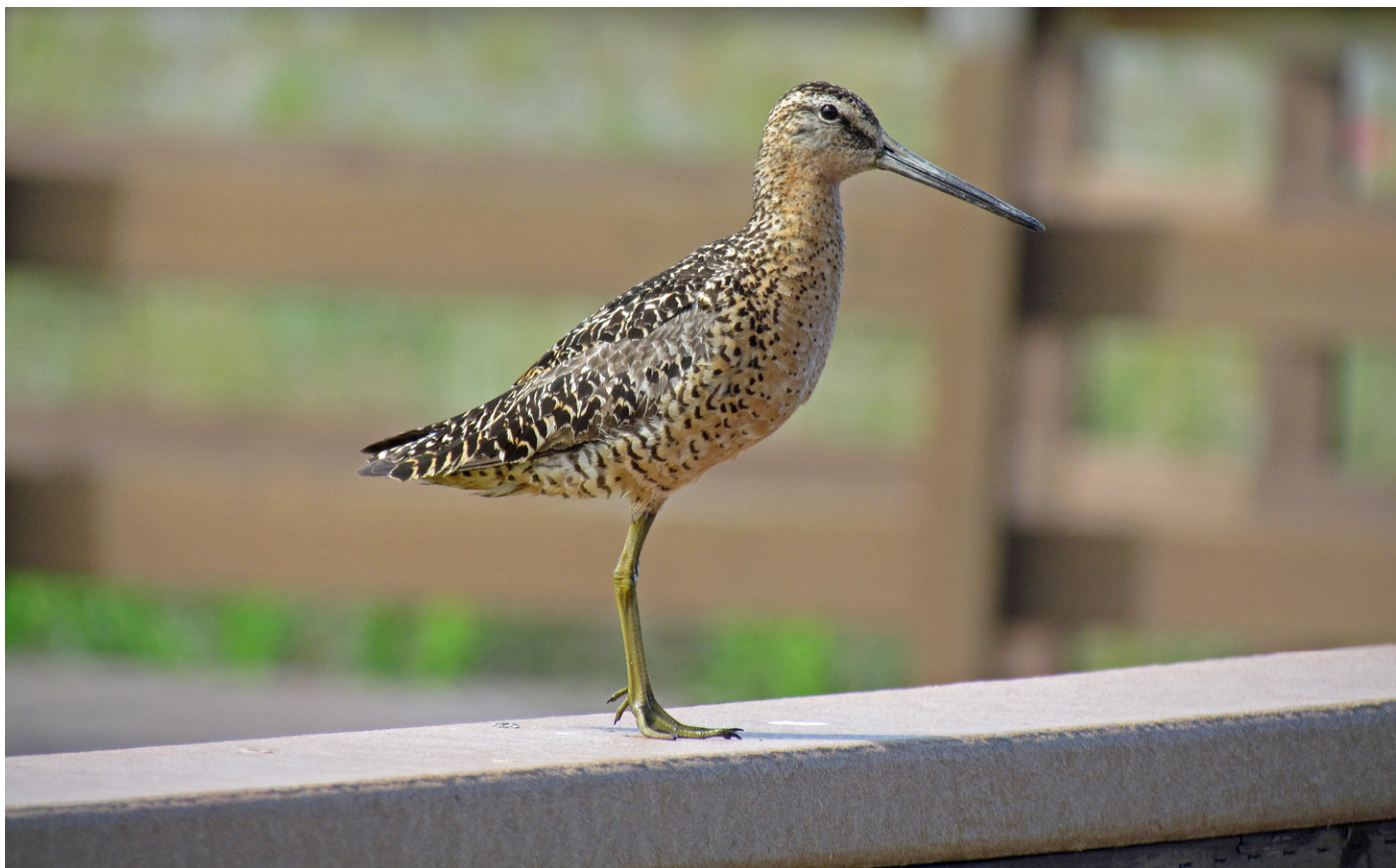
Kortnebbekkasinsnipe på Board Walken i Potter Marsh.