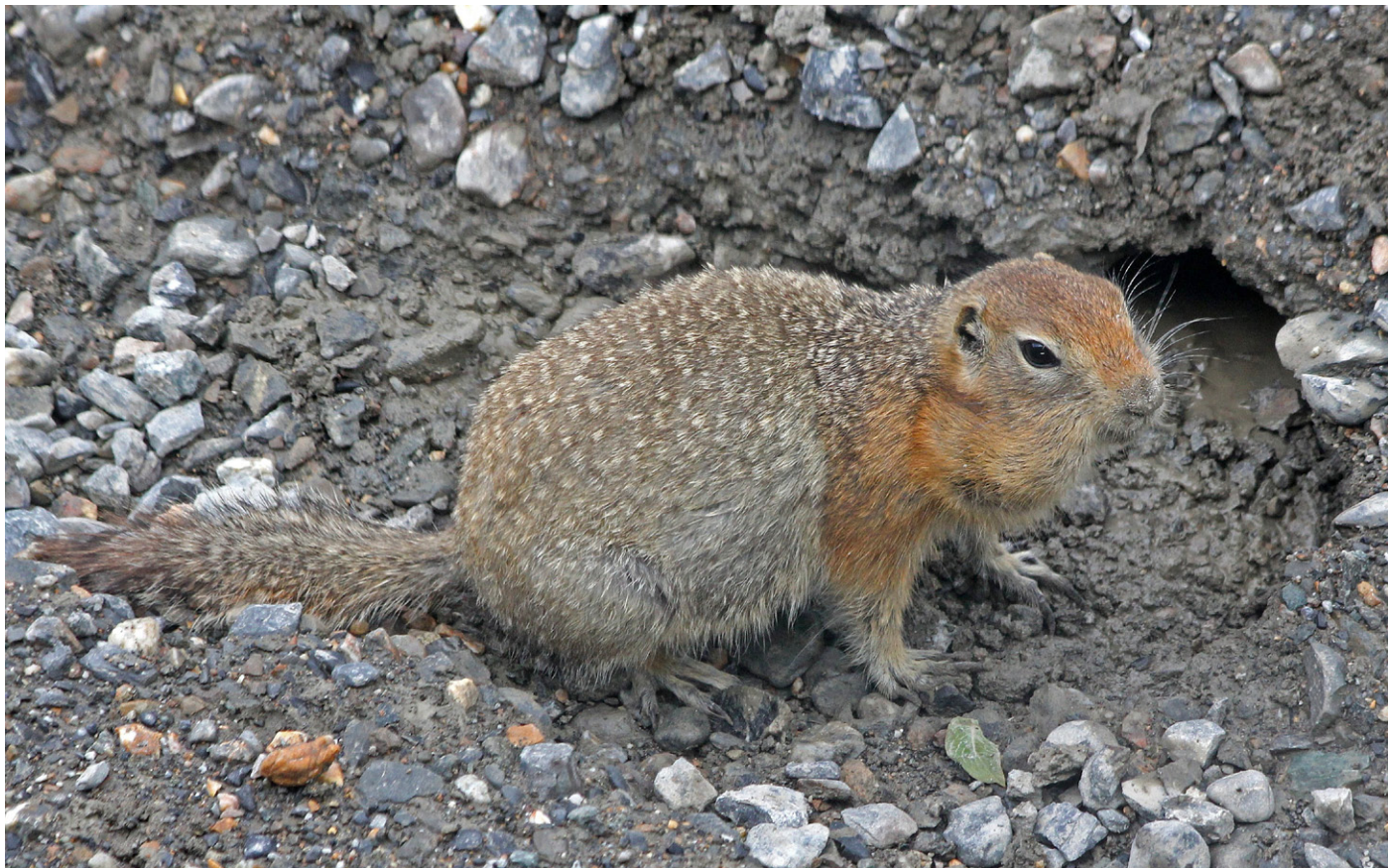
Polarsisel, en jordekorn-art.

Vi møtte opp kl 5:00 i Wilderness Access Center i Denali National Park. Vi skulle ta morgenens første Shuttle Bus inn til Wonder Lake og tilbake. Vi passerte disse lokalitetene på vår vei innover mot Wonder Lake: Horseshoe Lake, Savage River Campground, Savage River, Sanctuary River, Teklanika River, Igloo Creek, Tattler Creek, Sable Pass, Polychrome Pass, Porcupine Forest, Highway Pass, Thorofare Pass og Eielson Visitor Center. På sistnevnte sted hadde vi en lengre stopp.