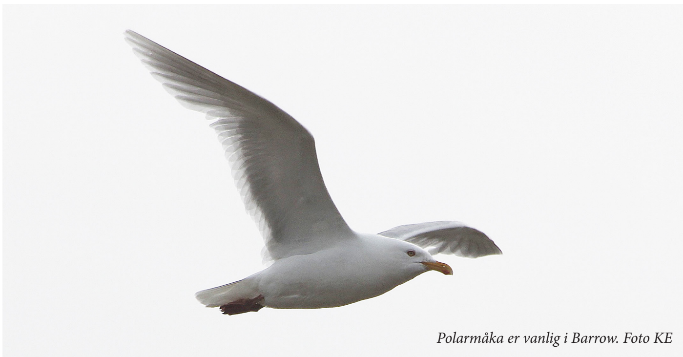
Polarmåka er vanlig i Barrow.

Det var 14 forventningsfulle og blide mennesker som møtte opp på Gardermoen for å ta noen lange flyturer vestover og nordover til Alaska. Vi skiftet fly i Reykjavik og i Seattle. På turen fra Seattle hele veien opp til Anchorage ble turledelsen underholdt av gamle Bill L. som bodde i Barrow og hadde ei hytte ved Anchor Point. Hytta kunne vi låne, og han forklarte hvor nøkkelen hang. Det å få noe søvn kunne vi glemme. Sent, men godt ankom vi Anchorage, og fant benkene vi kunne sove på i en stor hall i terminalbygget på flyplassen.