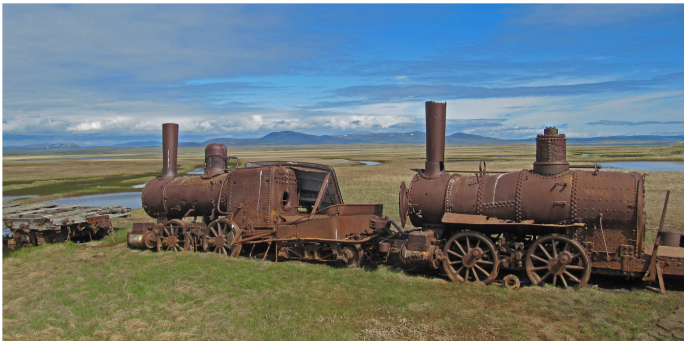
Last Train to Nowhere.

Ved 23-tiden om kvelden gikk brannalarmen på hotellet. Det var en gjennomskjærende, forferdelig låt, og det måtte være svært enkelt å evakuere rommene med den lyden. Etter hvert kunne vi tusle inn på rommene våre for å prøve å få noen timers søvn.