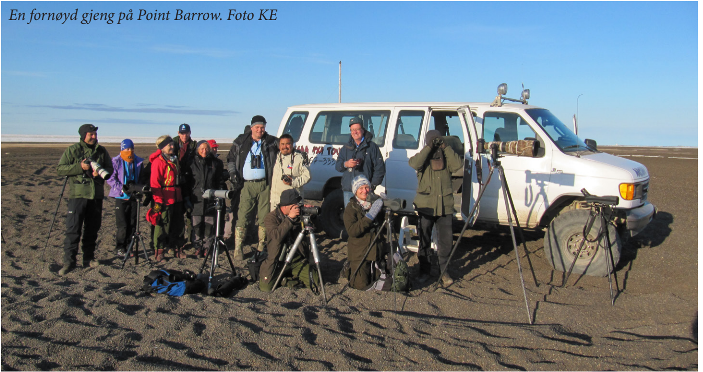
En fornøyd gjeng på Point Barrow.

Vi klarte å løsrive oss fra denne flotte opplevelsen og satte kursen sørover(selvsagt) til Freshwater Lake. På veien stoppet vi innom hotellet og et utkikkspunkt utover Chukchi Sea og et grustak. Ved Freshwater Lake tok vi på oss gummistøvlene og ruslet utover den våte tundraen. Der oppdaget vi turens første brilleærfugl hann, og vi så den også sammen med praktærfugler. Stellerender var det også her.