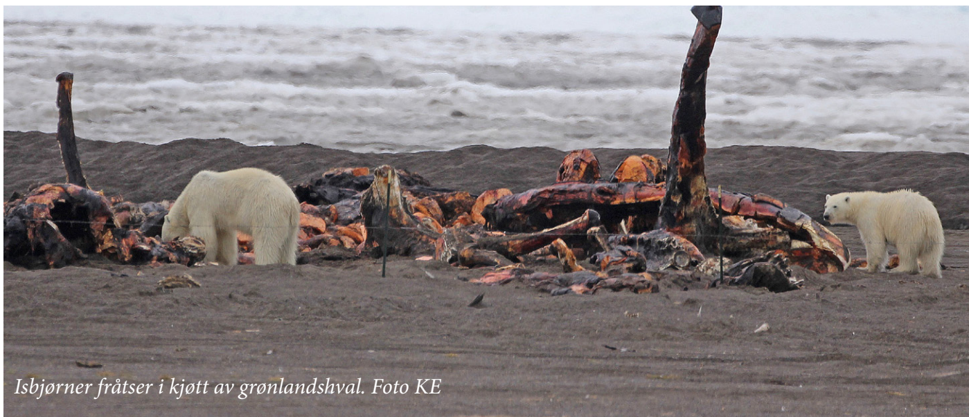
Isbjørner fråtser i kjøtt av grønlandshval.