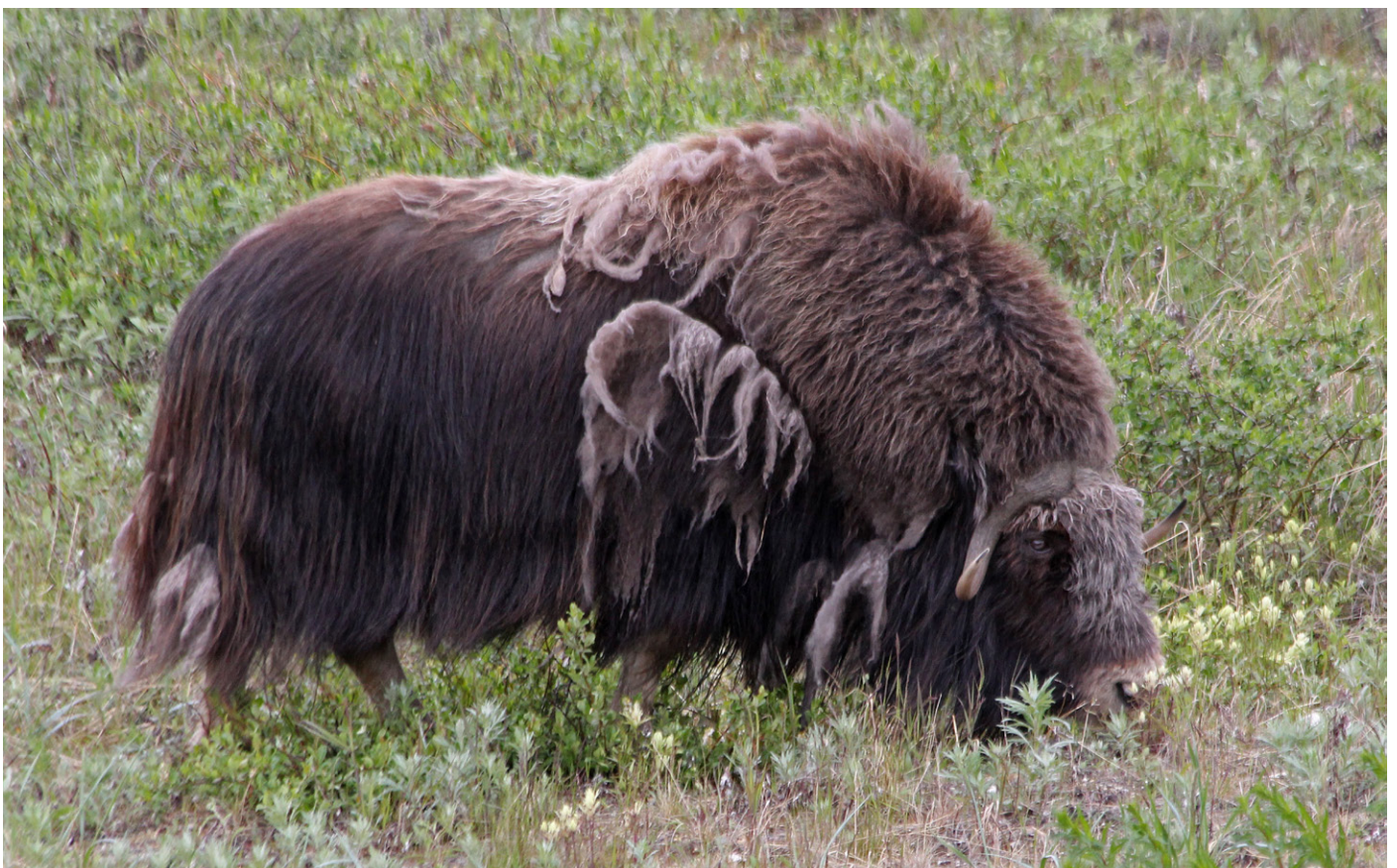
Moskus i Nome.

Denne morgenen startet vi i Nome med å finne 39 moskus i utkanten av byen. Vi fulgte Teller Road ut av byen. En stor flokk med rein så vi også fra veien. De er etterkommere av norske tamrein, pga. et mislykket prosjekt med å starte tamreindrif i området.