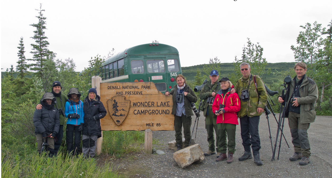
Noen av turdeltagerne ved Wonder Lake.

Ved Wonder Lake var det en del mygg. En islom lå på reir, mens maken svømte omkring på vannet. Vi så mange pattedyr på turen: 9 brunbjørn, 1 rødrev, 20 polarsisel, 1 ekorn, 1 snøskohare, 4 elg, 25 rein og 30 tynnhornsau. Ei bjørnebinne med to unger var høydepunktet på turen. Grizzlybjørn, kodiakbjørn, alaska-brunbjørn og vår hjemlige brunbjørn er alle samme art, brunbjørn Ursus arctos . To av underartene i Alaska er grizzlybjørn Ursus arctos horribilis og kodiakbjørn Ursus arctos middendorffi , mens vår bjørn er Ursus arctos arctos . Etter dagens lange økt inne i nasjonalparken avsluttet vi med middag i tettstedet Denali.