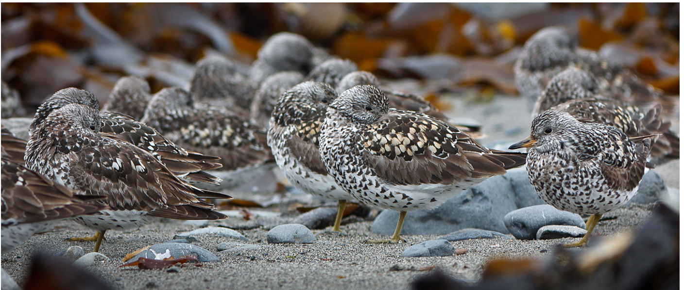
Brottsniper ved Anchor Point.