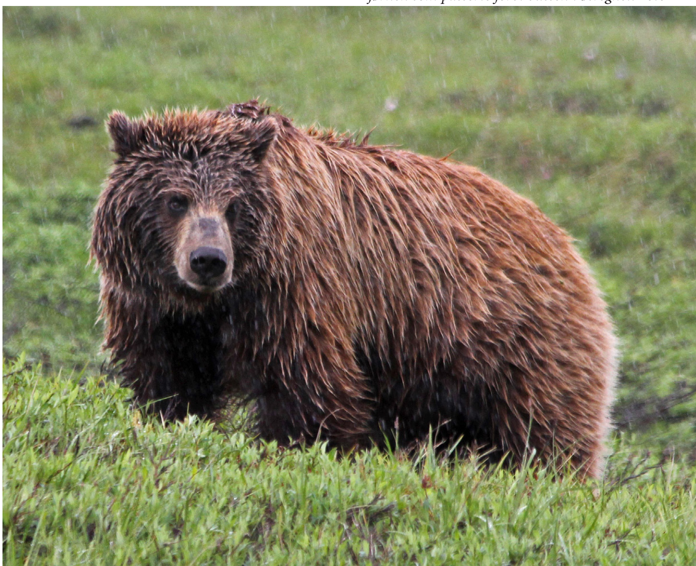
Bjørnen som passerte forbi bussen i øsregnet.