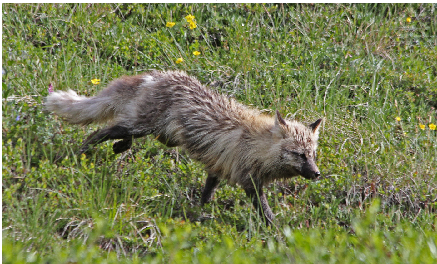
Rødrev på jakt etter polarsisel ved Eielson Visitor Center.