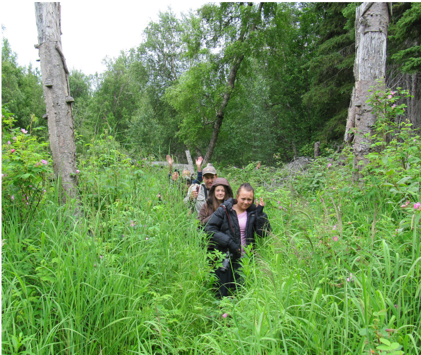
Spasertur i bjørneterrang langs Kenai River.

Etter skogturen stoppet vi i Soldotna, og spiste middag på en kina-restaurant. Om kvelden ankom vi Anchor River Inn hvor vi skulle overnatte de neste to nettene. Veldig sent på kvelden dro noen få ut til Anchor Point og utløpet av Anchor River. Den gamle vulkanen Mount Iliamna kunne tydelig sees tvers over Cook Inlet i solnedgangen, samtidig som hvithodehavørnene fråtset i fisk på stranda.