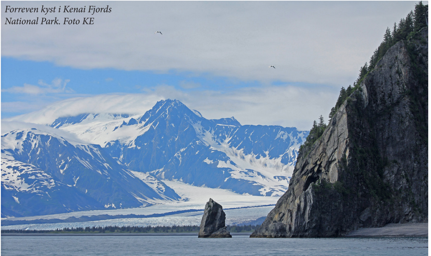
Forreven kyst i Kenai Fjords National Park.