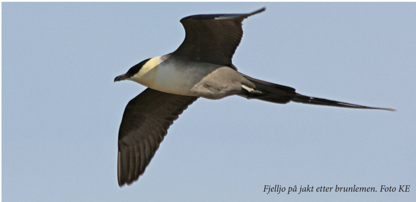
Fjelljo på jakt etter brunlemen.

Deretter gikk vi på en tørr åskam vest for Freshwater Lake Road og ned til Nunavak Bay. Der fant vi et reinkadaver, som kanskje var felt og spist på av ulv. Her hekket det rustsnipe for 3 år siden, men ikke nå lenger.