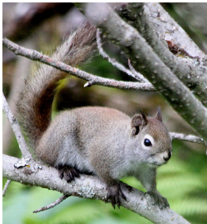
Et ekorn, Red Squirrel, ved Beluga Slough.

Kenai River Flats bør besøkes mens man er i området, og vi så utover de vidstrakte engene her ved utløpet av Kenai River. Datoen 4.juli tilsa at det var mange arrangementer i byer og tettsteder denne dagen. Vi opplevde 4.juli bilkø inne i Kenai, og valgte å forlate området.