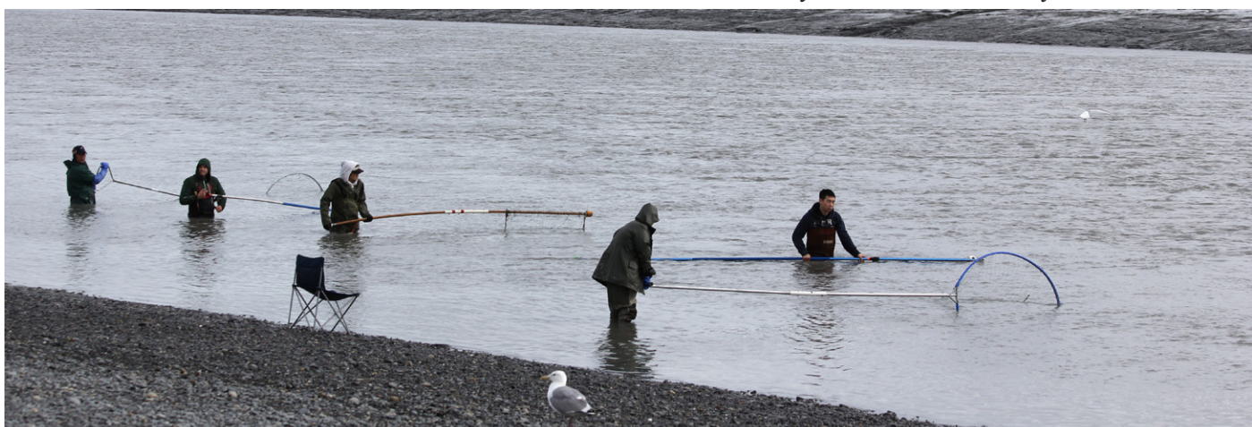
Laksefiske med hov i Kasilof River.

Vi tok noen korte stopp på veien tilbake, og da så vi snøgeit, tynnhornsau og svartbjørn. Midt oppe på Turnagain Pass hadde en motorsykkelgjeng etablert seg og delte ut kaffe. Nordmenn sier ikke nei til gratis kaffe, og en av motorsykkelgutta fortalte at han hadde vokst opp med det norske flagget hengende på veggen hjemme.