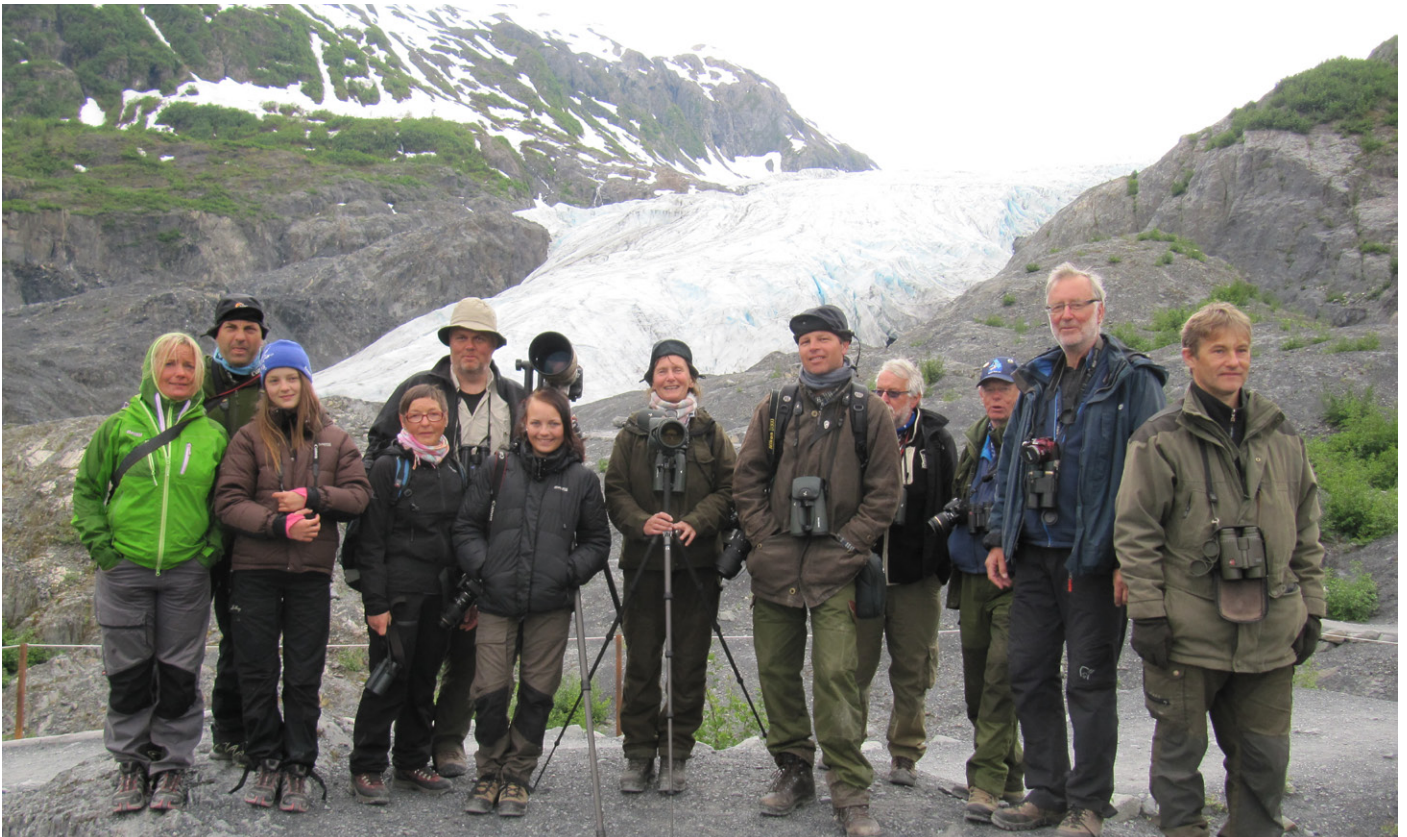
Gjengen foran Exit Glacier.

Deretter dro vi tilbake til hotellet i Seward for å sjekke ut. Etter å ha forlatt Seward gikk vi på en skiløypetrase som slynget seg gjennom den tempererte regnskogen. Denne barskogen består mye av sitkagran og hemlock. Her så vi granspett, gråsolitærtrost, båndtrost, granparula, stripesisik, konglebit og båndkorsnebb. Dette er en frodig barskog dekket med mose og lav takket være mye nedbør. Snømengden om vinteren er på noen meter.