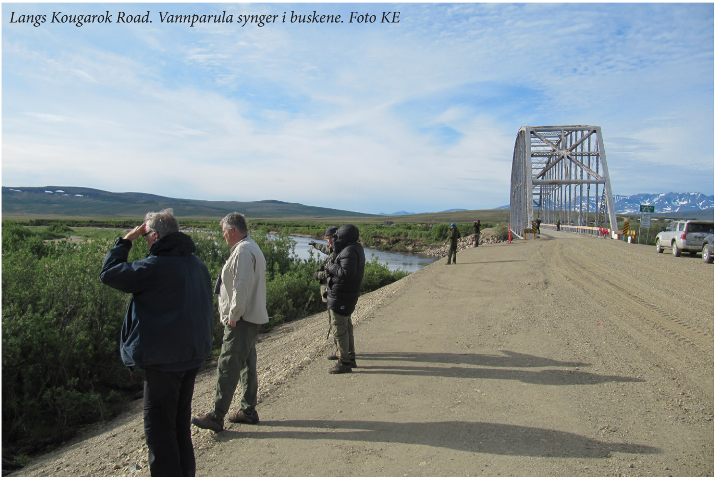
Langs Kougarok Road. Vannparula synger i buskene.

På veien tilbake tok vi oss god tid og stoppet flere steder. Der veien krysset elver var det viktig å sjekke. Det var mye småfugl på denne strekningen, og spesielt bra med parulaer, spurver, svaler og skogtroster. Det var enkelt å høre de ulike artenes sang, og spesielt vannparulaen imponerte med sin varierte og kraftige sang. På ei bru lå det to ravnunger i et reir og kikket ned på oss. Det var en del fisk i elvene, og vi så Arctic Grayling (en harrart) og en art av stillehavslaks(muligens Sockeye).