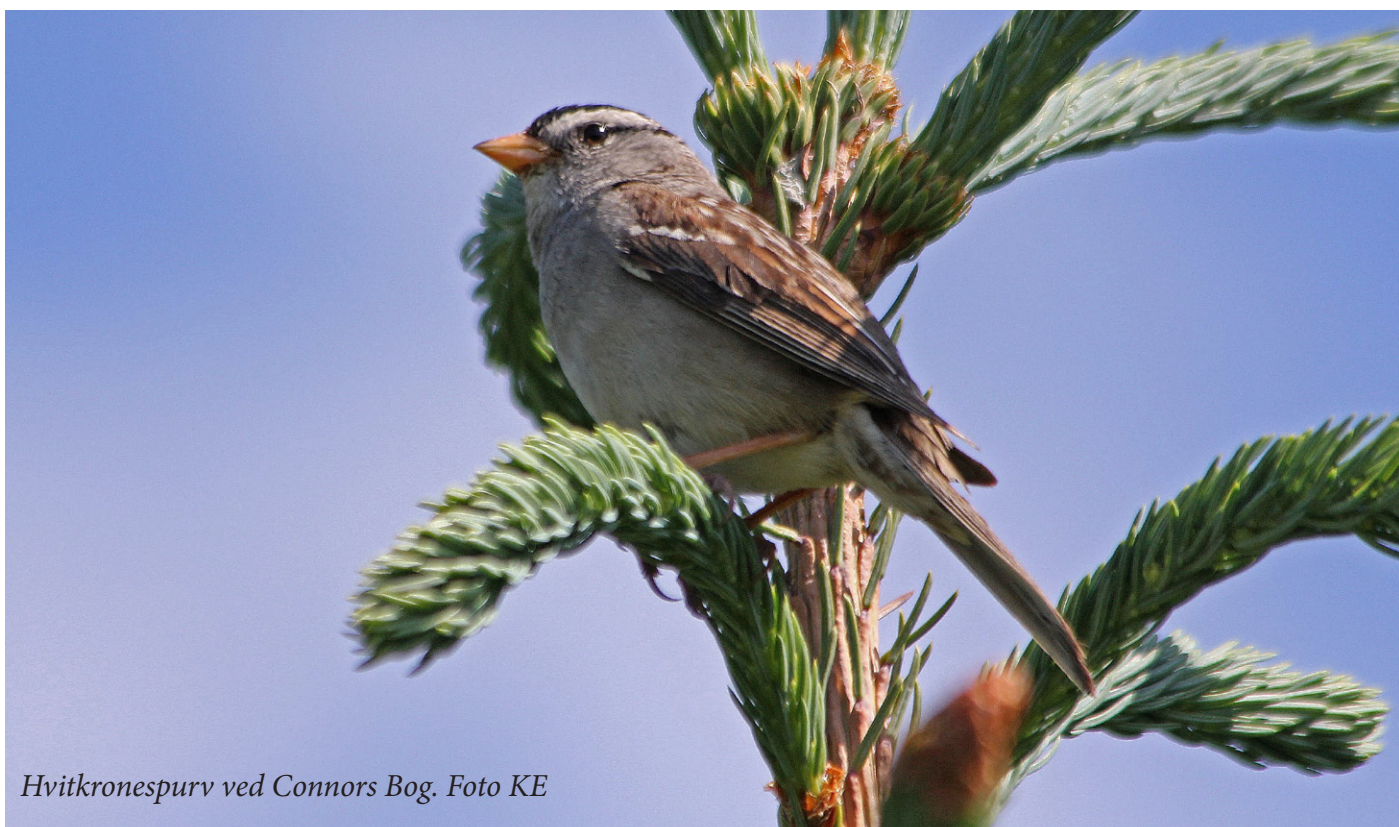
Hvitkronespurv ved Connors Bog.

Denne morgenen ble avtaler og rutiner kraftig forstyrret av en isbjørn som ruslet nordover på isen utenfor hotellet vårt. Man kunne se isbjørnen fra hotellrommene for de som hadde sjøutsikt. Vi hoppet ut mer eller mindre påkledd for å oppleve denne bamsen bedre. Det var en verdig avslutning på vårt opphold i Barrow, og vi følte at vi atter hadde good spirit.