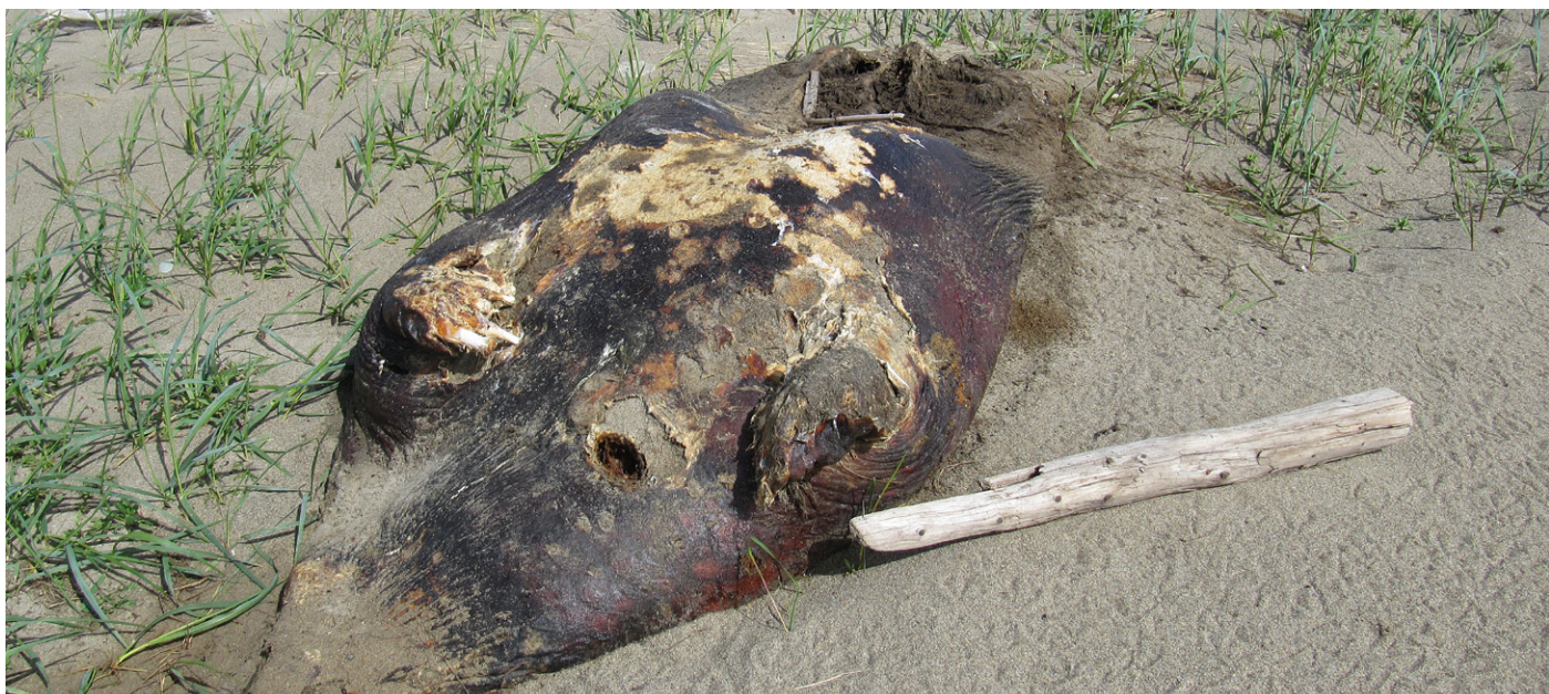
Død hvalross på stranda ved Safety Lagoon.

Vi startet meget grytidlig for å kjøre nonstop på Kougarak Road til en spesiell åskam. Vi skulle søke etter en av de sjeldneste vaderne i Nord-Amerika, alaskaspove. Vi visste at dette kunne være vanskelig og antagelig krevde 6 timers vandring i meget krevende terreng. Med det samme vi hadde parkert bilene langs veien hørte vi fluktspillet til alaskaspoven. Den spesielle og karakteristiske lyden var ikke til å ta feil av. Skulle det være så enkelt å finne alaskaspove? Dette var jo altfor enkelt! Vi kunne beskue den mens den satt og gikk på bakken, og innimellom tok en spillflukt. Vi sto på veien og nøt synet av spoven og lyden dens. For moro skyld prøvde noen av oss å teste terrenget et stykke unna spoven, og konklusjonen var at vi var svært heldige som slapp å gå i dette tuete kratt-terrenget. I tillegg til alaskaspove, var det også noen småspover i området. Vi kunne også nyte syngende bjørkespurv.