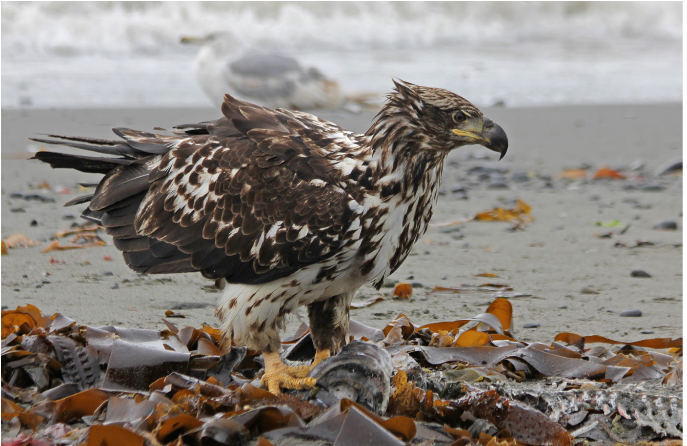
Ung hvithodehavørn ved Anchor Point.