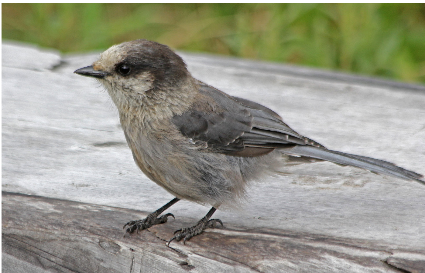
Gråskrike ved Wonder Lake.