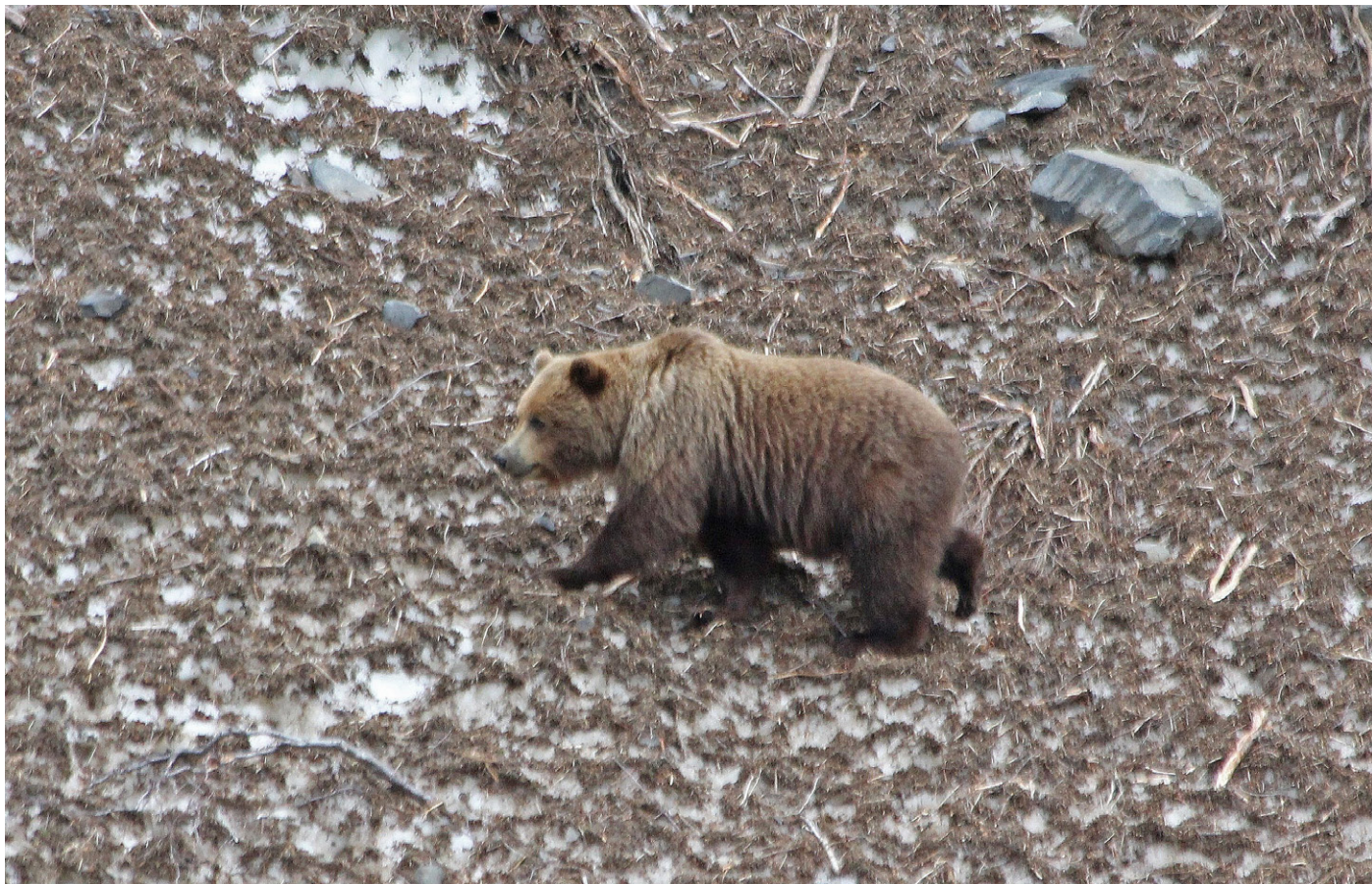
Bjørn langs hovedveien inn mot Anchorage.

På nordsiden av Turnagain Arm ikke langt fra Anchorage sto det mange biler parkert langs veien, og da er det viktig å stoppe for å sjekke årsaken. Før vi fikk stoppet så vi et stort brunt vesen til høyre for veien, brunbjørn. Vi var her en stund for å nyte og fotografere turens siste bjørn. Det var en sterk avslutning på Alaska-turen vår. Vi stakk innom Potter Marsh igjen, før vi ankom hotellet vårt. Etter en sen middag var det på tide å pakke for neste dags flighter.