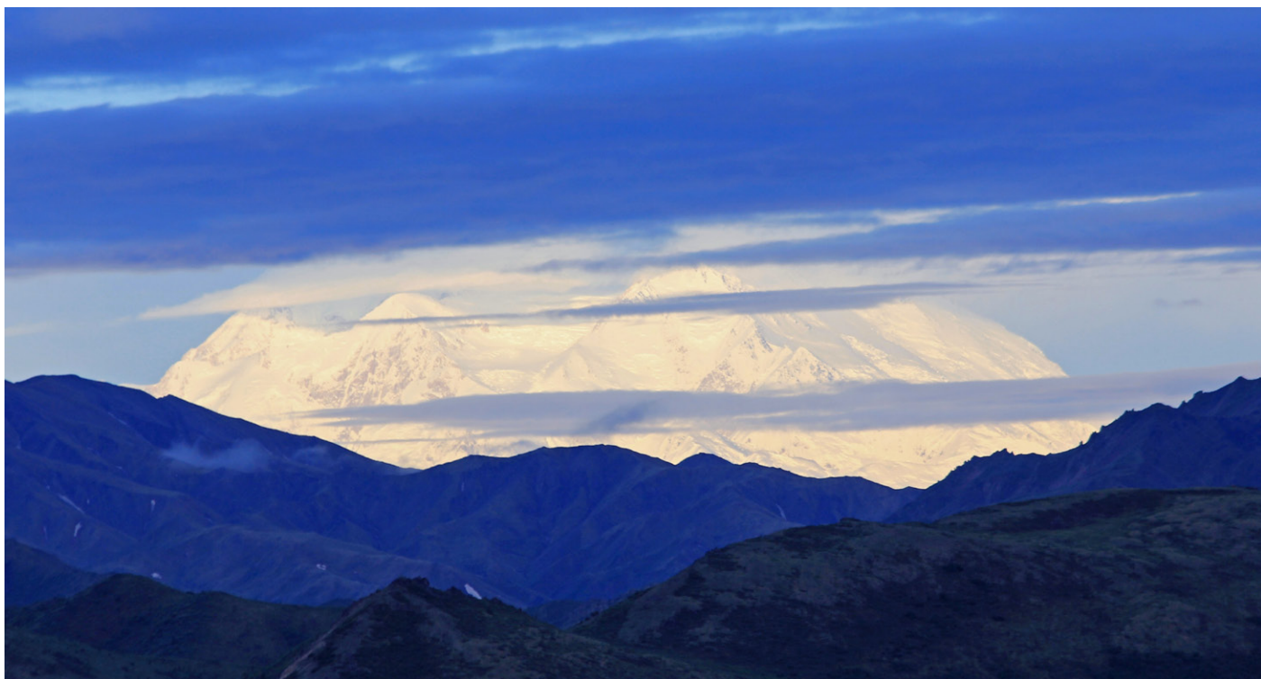
Mount McKinley sett fra Eielson Visitor Center. Toppen er i skylaget.