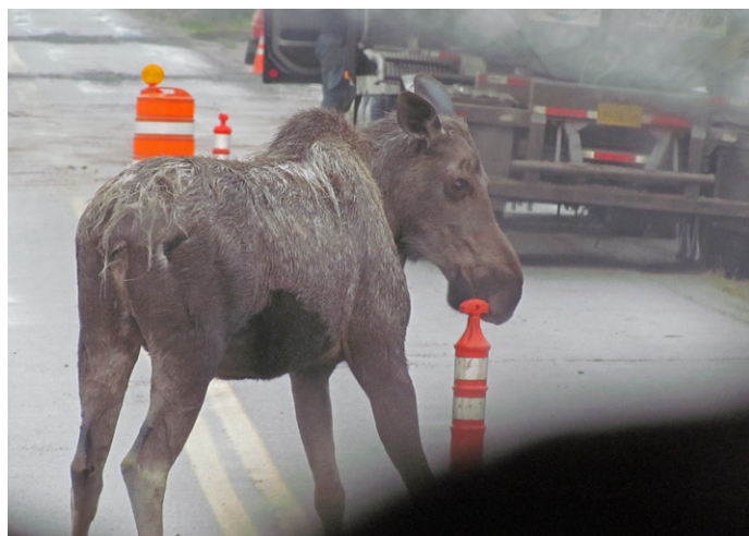
Elgkalv som mobber veimarkering.