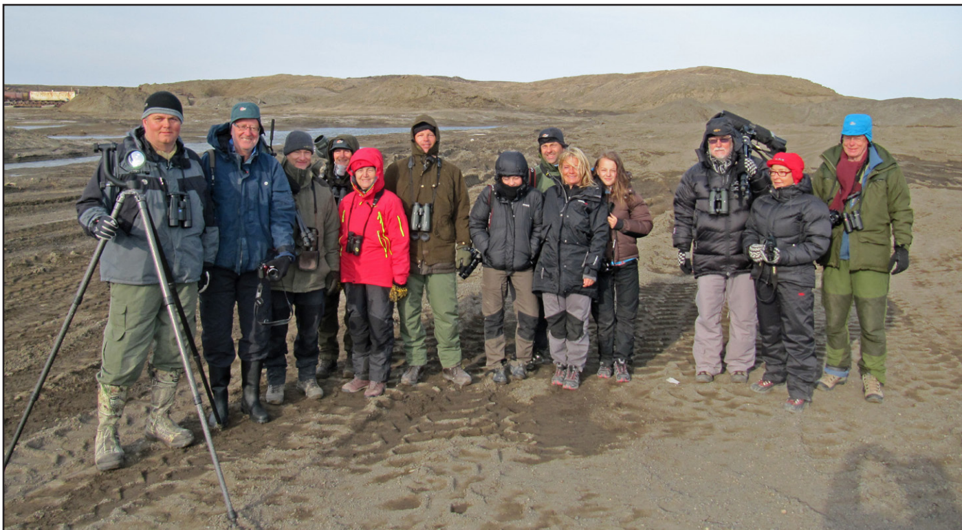
Gruppebilde tatt i grustaket like utenfor Barrow.