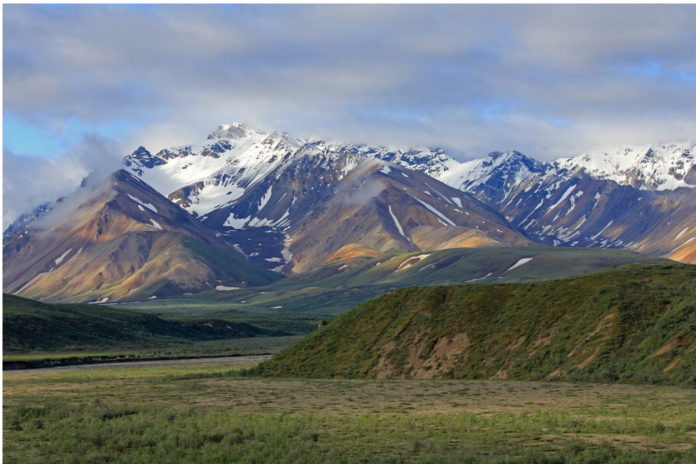
Elvedaler og fjell i Denali National Park.