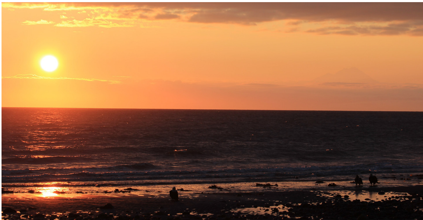
Solnedgang sett fra Anchor Point med Mount Iliamna og hvithodehavørner.